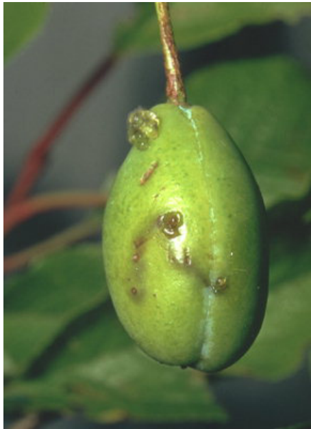
Штети на плод Сливов црв ( Cydia funebrana )