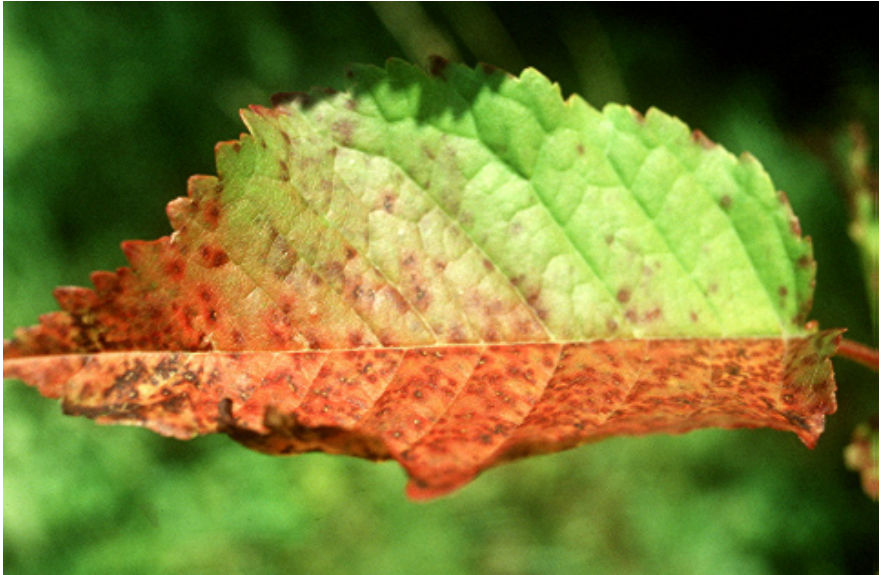
Пепелница ( Polistigma rubrum )