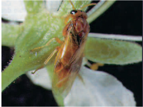
Слимова оса ( Hopllocampa flava )