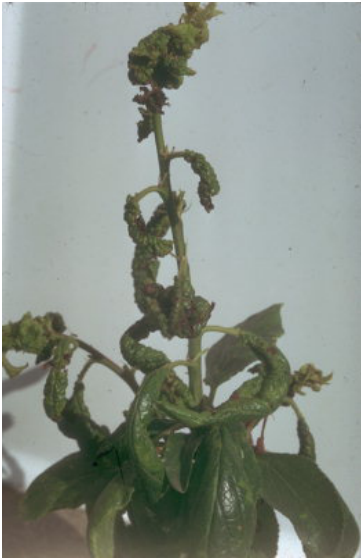
Слимова штитеста вошка ( Brachycaudus helichrysi )