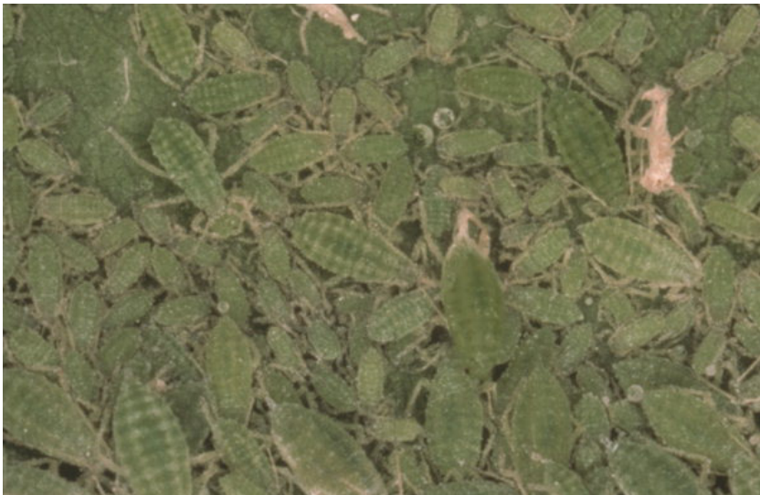
Лисна вошка ( Hualoapterus pruni )