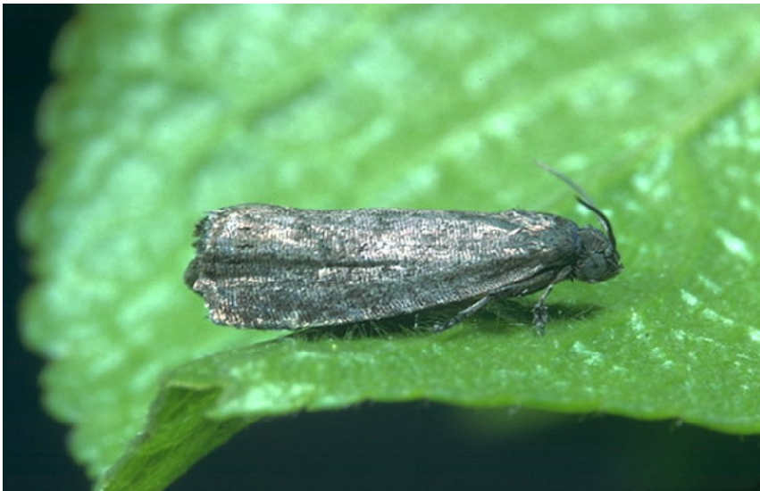
Сливов црв ( Cydia funebrana-imago )